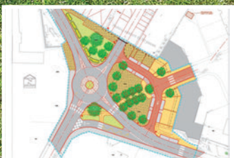
ZAC Cœur de Ville, début des travaux >6