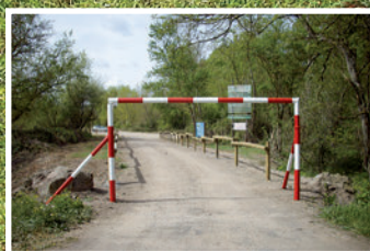
Aménagement de l'accès de Chavennes >12