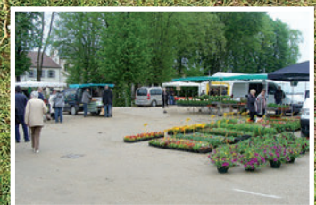
Marché des producteurs de Pays >5